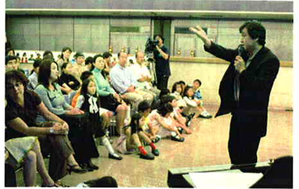
大野さんも一緒に見学してくれました！