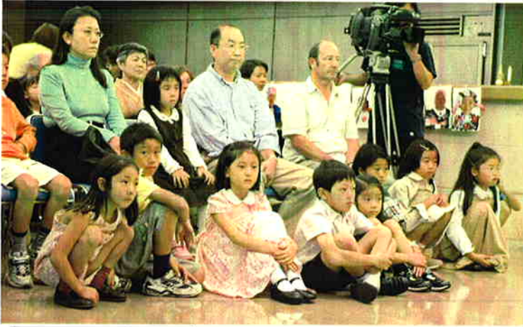
みんな真剣そのもの！