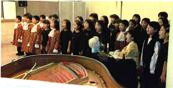
イタリア語で元気一杯に歌ってくれました。