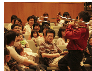
※写真はイメージで、実際の出演者や会場とは異なります。