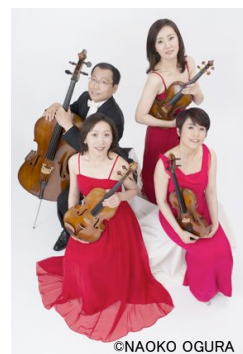
クアルテット・エクセルシオ (弦楽四重奏)