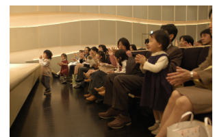
※写真はイメージで、実際の出演者や会場とは異なります。