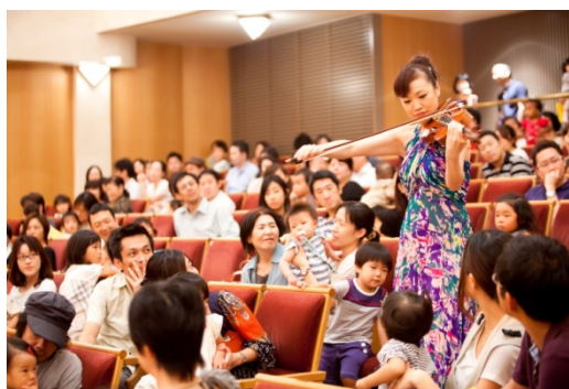
客席から登場するシーンも