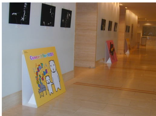
ロビーでは初めてのコンサート来場の記念撮影可能