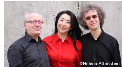
【モーリス・ブルグ・トリオ】