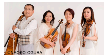
クアルテット・エクセルシオ(弦楽四重奏)