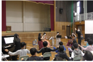
採択事例②（島根県） 松江音楽協会 「わくわく★音楽体験事業」