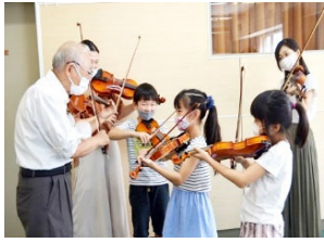
採択事例①（岐阜県） 棕バイオリンクラブ 「こどものためのバイオリン教室」