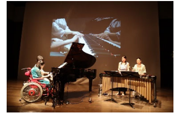
採択事例③（東京都） ひとさし指のノクターン 「わくわく！みんなで楽しむコンサート～障がいのある人もない人も一つになって～」