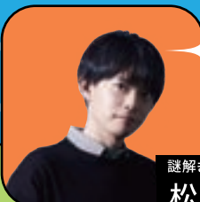
謎解きクリエイター 松丸亮吾 プレゼンター